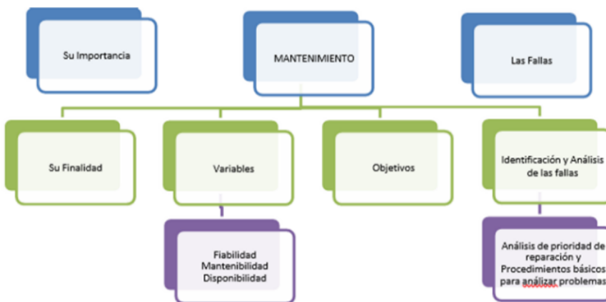
Figura 1. Esquema conceptual de mantenimiento

El mantenimiento de equipos eléctricos detecta fallas emergentes que pueden provocar paradas de planta y/o accidentes que afecten a personas y equipos en el corto y mediano plazo. Reduzca el tiempo de inactividad minimizando el riesgo de cortes de servicio inesperados y no planificados participando en la planificación de reparaciones y mantenimiento. Los beneficios de reducción de costos incluyen ahorro de energía, protección de equipos, velocidad de prueba y diagnóstico, y verificación de reparación rápida y fácil. Para tableros eléctricos se debe reportar las lecturas de todos los instrumentos tales como: Voltímetro, Amperímetro, Caudalímetro, etc. Elimine el goteo o la condensación en la unidad, limpie la suciedad y revise las partes metálicas en busca de sobrecalentamiento o corrosión. Existen diferentes tipos de mantenimiento de equipos eléctricos: programado, correctivo, preventivo y preventivo.