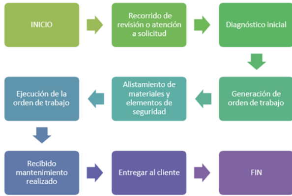
Figura 1. Esquema mantenimiento correctivo.