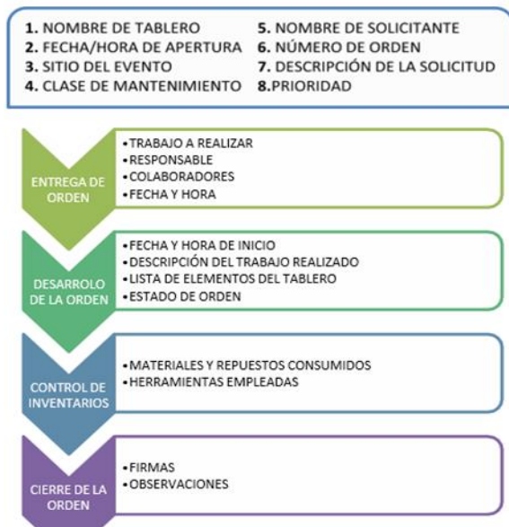
Figura 4. Esquema del orden del mantenimiento.